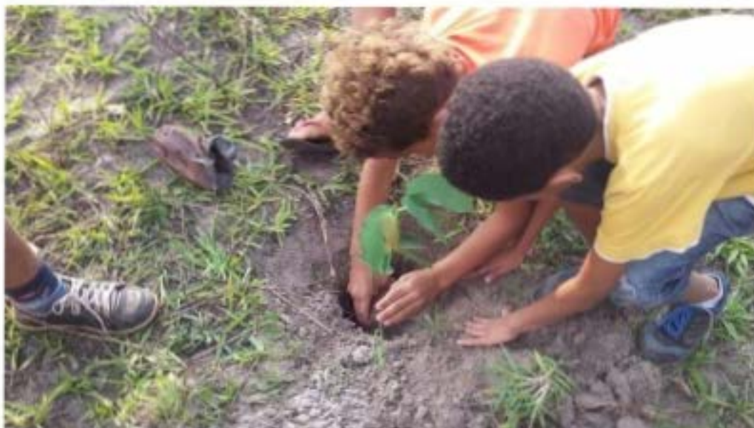
VISITA A NASCENTE E PLANTANDO ÁRVORES