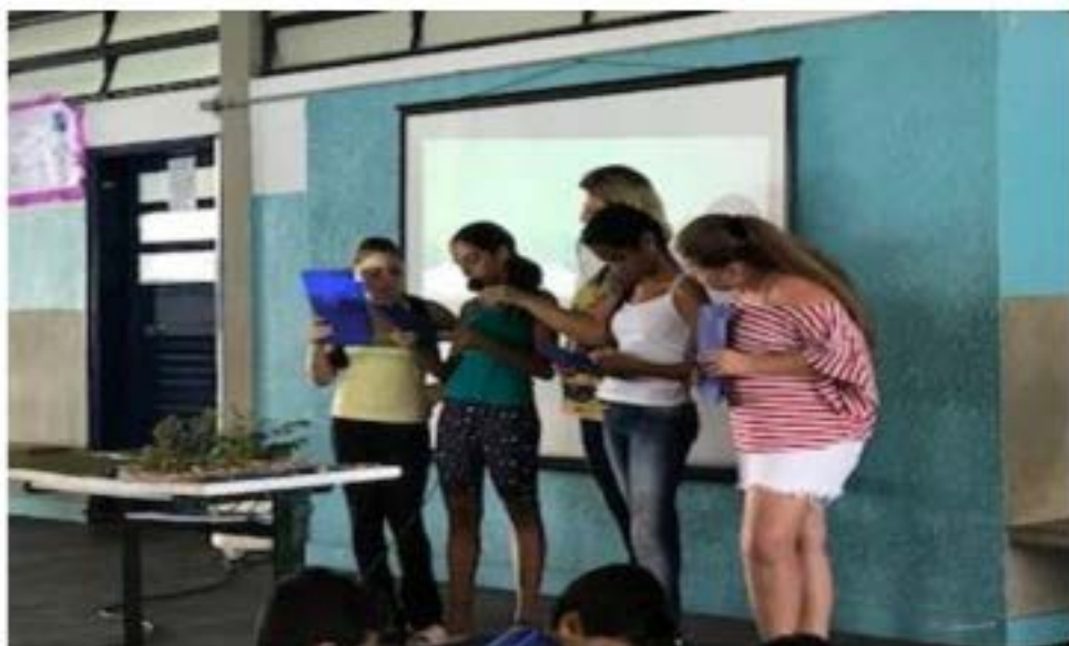
Apresentação do Trabalho pelos alunos do 7º ano da EE José Florêncio do Amaral