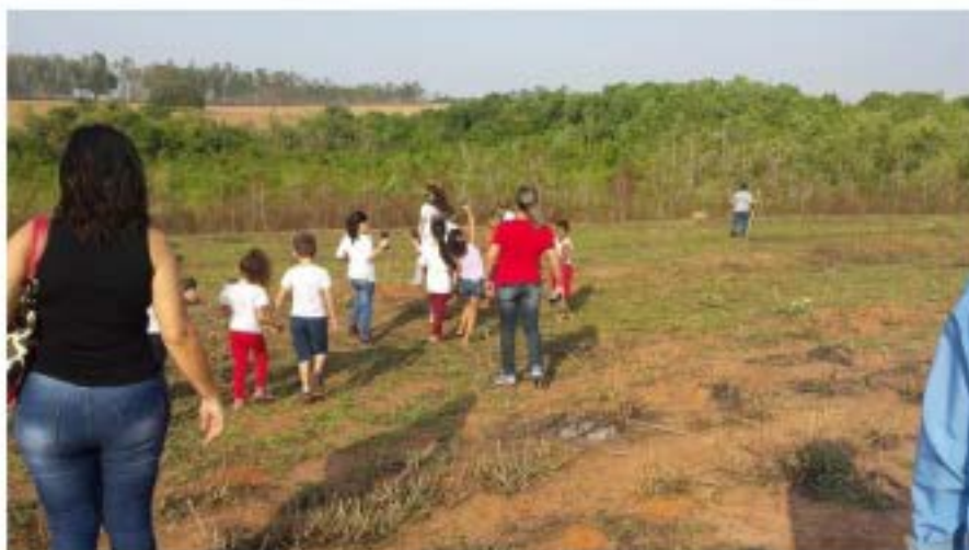
Caminhada no sítio São Vitorino

Como forma de dar continuidade ao trabalho de sensibilização e conscientização foi realizado uma caminhada no sítio São Vitorino, mediante a execução do Programa Proteção de Nascentes, foi realizada nesse trabalho atividades de educação ambiental com as crianças em idade escolar, alunos do 2º ano da Escola Municipal Dionísio Tonete. Durante a caminhada, realizada até a nascente do Sítio São Vitorino, foram destacados aspectos do ambiente e junto a nascente com a mata ciliar pouco formada, foi enfatizados aspectos relacionados com a importância das matas ciliares para as encostas, nascentes, arroios e rios e os cuidados necessários com os recursos hídricos, também foram plantadas 10 mudas de árvores em torno da nascente. E com os alunos da Escola Estadual José Florêncio do Amaral foi realizado uma maquete e apresentação do trabalho sobre o reflorestamento da mata ciliar na proteção das nascentes na própria escola com os alunos do 7ºano.